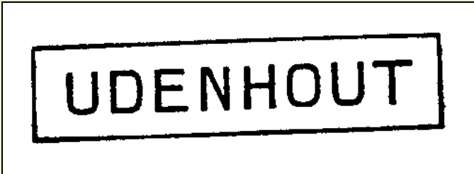
Dit stempel is dus nooit op het hulppostkantoor van Udenhout gebruikt.

Ten behoeve van het ‘kenmerken’ van de brieven die aan het station van Udenhout werden afgegeven en waarop nog géén stempelafdruk van UDENHOUT zelf voorkwam, werd een haltestempel vervaardigd. Dit stempel ontving de conducteur van de trein op de spoorlijn Tilburg-'s-Hertogenbosch-Nijmegen op 4 juli 1881. Het stempel diende ervoor om het juiste tarief te kunnen bepalen vanaf Udenhout tot aan de plaats van bestemming.