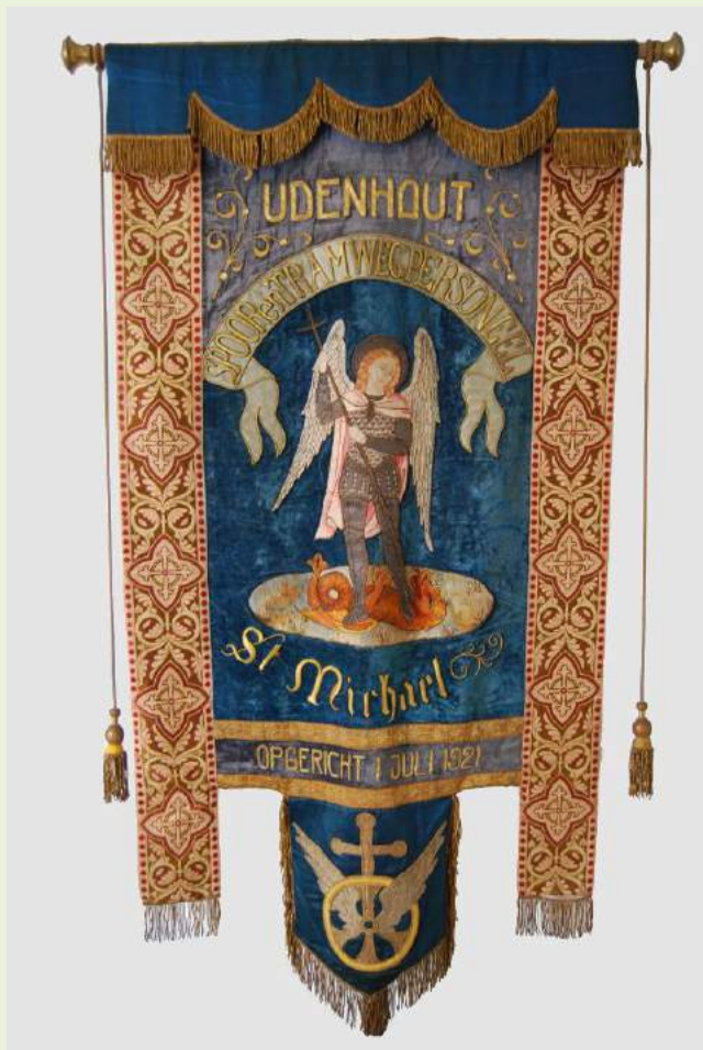
Het vaandel van de Udenhoutse spoorwegmedewerkers