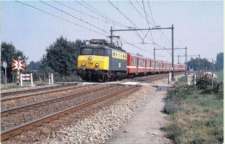
Locomotief 1106 met Belgische M2-rijtuigen als trein 4639 van Zwolle naar Roosendaal nabij KM 7.1, Udenhout, 8 september 1989, Meindert Mulder

© Heemcentrum 't Schoor, Schrijversteam. Alle informatie en foto's in deze folder zijn eerder gepubliceerd in boeken van het heemcentrum dan wel open toegankelijk op internet.