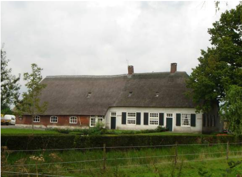
Eén van Biezenmortels oudste boerderijen: Hooghoutseweg 17/19