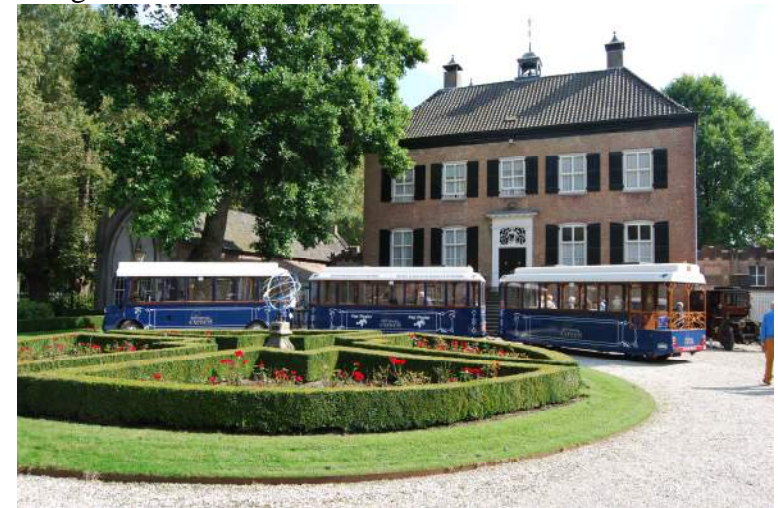
Open Monumentendag 2014