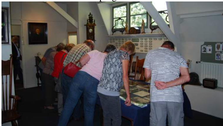
Aandacht voor de fototentoonstelling tijdens de Open Monumentendag op 't Schoor

Met dit jaarbericht over 2014 geven wij beknopt weer wat ons team van vrijwilligers het afgelopen jaar samen tot stand heeft gebracht. We zijn het afgelopen jaar erg actief geweest, zowel met het schrijven van diverse uitgaven als het aanpassen van onze huisvesting en de invoering van een nieuw collectiebeheerprogramma.