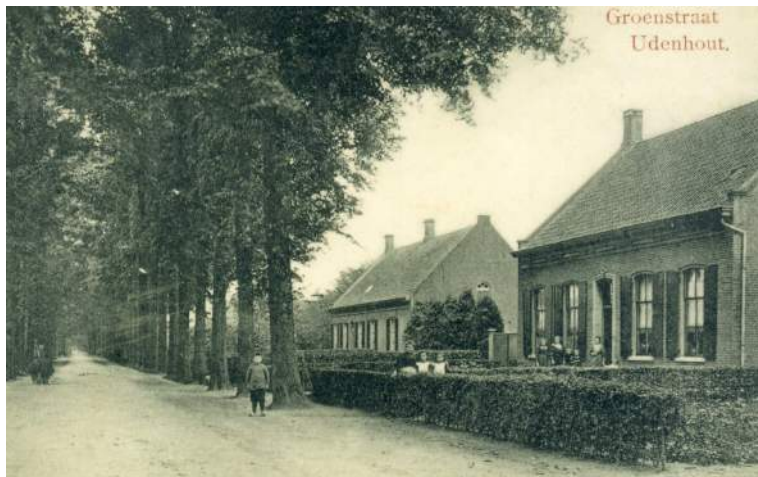
Het pand rechts, Groenstraat 70, is ook voorzien van een QR-code

In Biezenmortel zijn QR-plaatjes aangebracht aan Beukenhof en het hoofdgebouw van Huize Assisië. In Udenhout zijn 4 monumentale woningen voorzien van digitale informatie. Helaas is het niet mogelijk om te registreren hoe vaak gebruik wordt gemaakt van deze informatiebron.