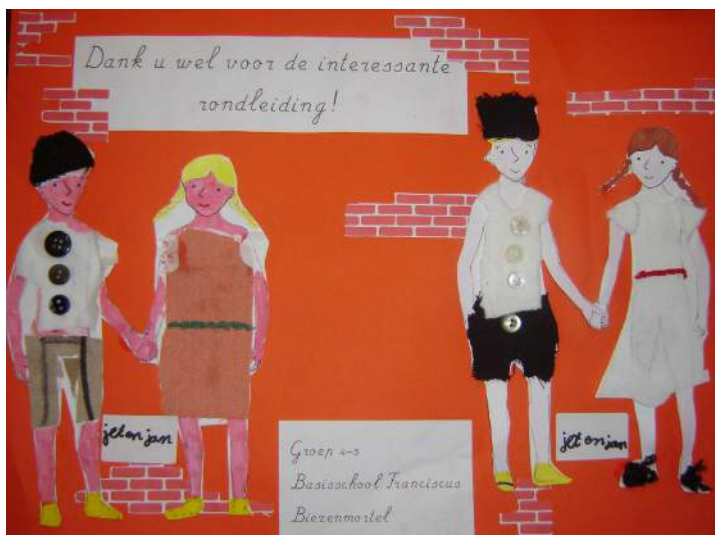
Een bedankje van de leerlingen van de Franciscusschool uit Biezenmortel voor het bezoek aan 't Schoor

Aan de activiteiten die we de scholen aanbieden wordt ieder jaar weer met veel enthousiasme door basisschool De Wichelroede deelgenomen.