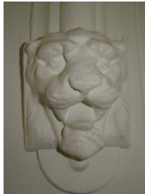
Detail van het stucwerk op de eerste verdieping

Gelukkig was het voor het bestuur mogelijk om in de verbouwperiode gebruik te maken van een vergaderruimte in het kasteel. Wij danken de kasteelheer hartelijk voor deze medewerking. Voor het gebruik van de twee verdiepingen van het pand Schoorstraat 2 is een nieuw tienjarig huurcontract met ASVZ afgesloten.