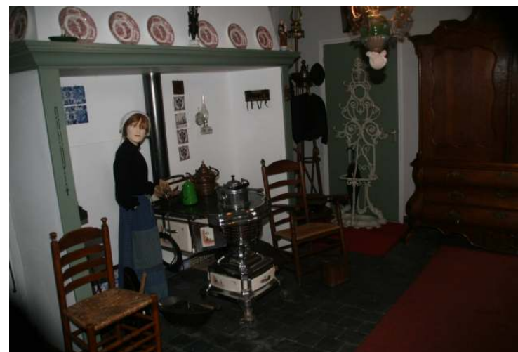
Den herd van 't Schoor

We verwachten in 2012 een nieuw meerjarig huurcontract te kunnen afsluiten.