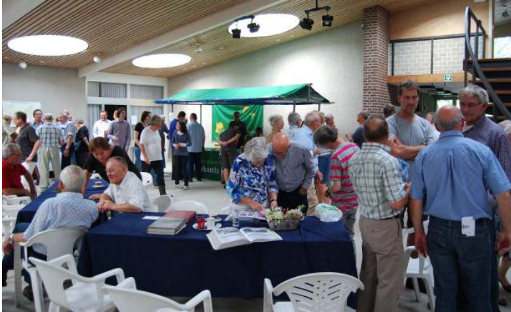
Open monumentendag in de showroom van de voormalige steenfabriek