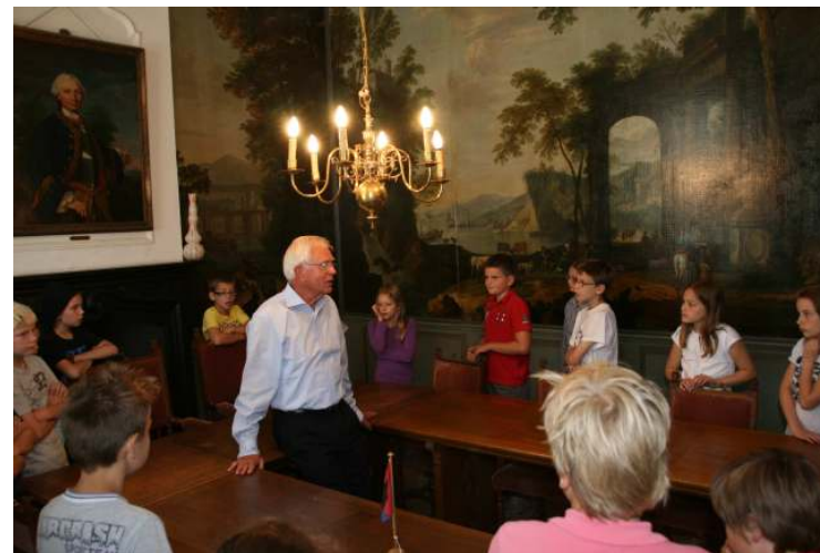
Rondleiding van de leerlingen van de basisschool tijdens de kasteelfeesten

We proberen de andere scholen in Udenhout en Biezenmortel ook voor dit project enthousiast te krijgen.