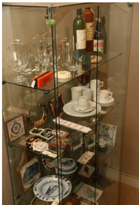
Promotieartikelen van de Udenhoutse middenstand

In 2011 heeft Heemcentrum 't Schoor flink aan de weg getimmerd. Twee evenementen, namelijk de kasteelfeesten en de Open Monumentendag, bezorgden ons veel publiciteit in de plaatselijke en regionale pers. Op beide evenementen kunnen we vol trots en met veel genoeg terugkijken.