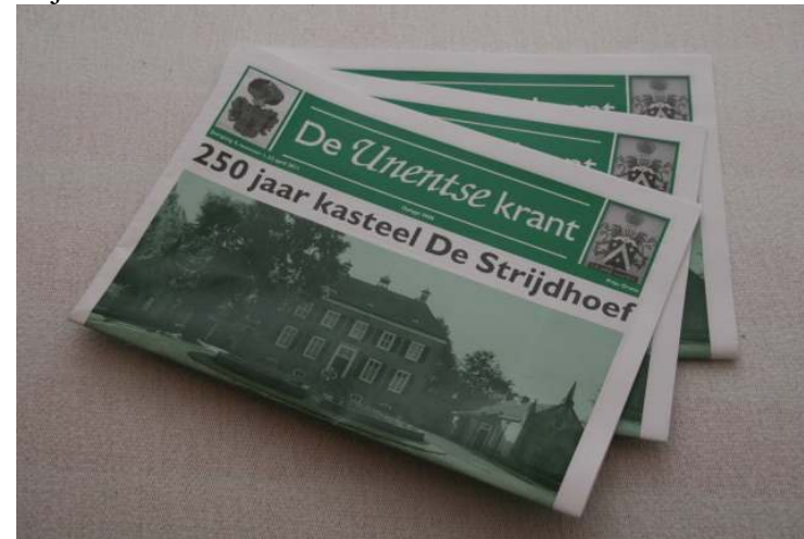
De vierde Unentse krant

Heemcentrum 't Schoor kwamen er veel complimenten binnen en speciaal over de twee pagina's met achtergrondinformatie over de kasteelstraten in de woonwijk De Mortel. Ook nieuwe Udenhouters sprak dit blijkbaar aan.