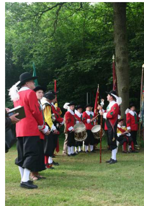
Het gilde bij de inwijding van het klokje

In gesprekken of onderzoeken naar het verleden van Udenhout en/of Biezenmortel wordt vaak gezocht naar oude namen van gebieden, straten, landwegen, waterlopen etc. die soms zijn verdwenen. Dat was voor 't Schoor aanleiding daar nader onderzoek naar te doen. Dit werd mede ingegeven door het beschikbaar krijgen van oude kaarten uit het kadaster. En zo ontstond er een werkgroep toponimie die zich gaat bezighouden met het achterhalen van oude locaties en namen daarvan. Voor een andere activiteit waarvoor een werkgroep werd