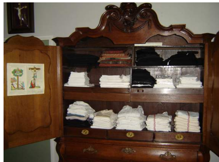
Ons kabinet in den herd

De collectie op ons heemcentrum en de prachtige boeken van het schrijversteam hebben in het algemeen betrekking op de periode vóór de jaren vijftig en zijn interessant voor de mensen die een deel van die periode hebben meegemaakt of daarover van anderen hebben gehoord.