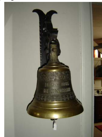
klok van de kinderen Kruijssen

Als toehoorder dacht ik: dit verhaal van Spapens is helemaal toegesneden op 't Schoor. Jammer dat hij niet even het bestaan ervan noemde. Ik was het met de spreker overigens helemaal eens, dat we er toch vooral voor moeten zorgen dat we de historie uit de periode van het rijke roomsche leven nooit verloren mogen laten gaan.