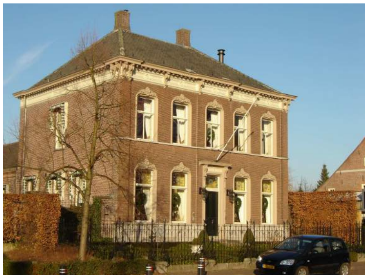
De oude burgemeesterswoning in de Slimstraat

spelen, als het om archeologische zaken gaat of als cultuurhistorische waarden in het geding zijn die mogelijk tot procedures kunnen leiden. Het moet dan wel duidelijk zijn, dat de heemkundekring aan de betreffende zaak grote waarde hecht en het moet gaan over algemene (ideologische) waarden en duidelijk geen privé-belangen. Daarom hebben we een werkgroep archeologie opgericht. Door opleiding en informatie via Brabants Heem wordt de werkgroep op de hoogte gebracht van die zaken die in voorkomende gevallen voor ons van belang zijn en is er naar de gemeente toe een contactpersoon aangewezen. In Udenhout en Biezenmortel staan verschillende oude historische en monumentale gebouwen. Het is belangrijk dat het aanwezig zijn van deze gebouwen goed wordt vastgelegd en gedocumenteerd. Een werkgroep oude gebouwen beraadt zich over de wijze waarop dat het beste kan gebeuren. We zullen met de informatie vertrouwelijk omgaan.