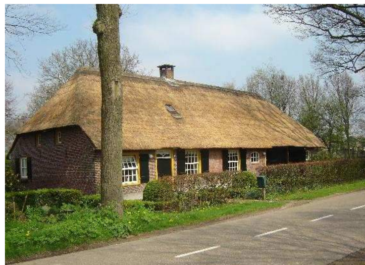
Boerderijtje aan de Hooghoutseweg in Biezenmortel