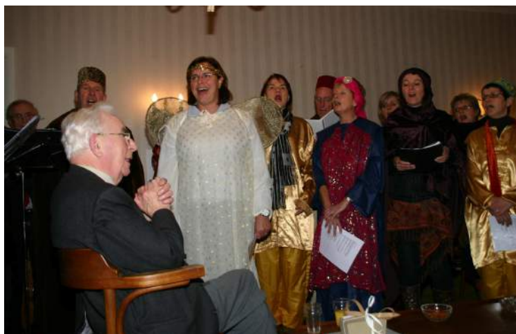
De muzikale ode van Andantino aan de rector

de eigenaar van het pand waren bij de oprichting van 't Schoor afspraken gemaakt over het gebruik van de ruimten in het pand zolang het bewoond werd door de rector.