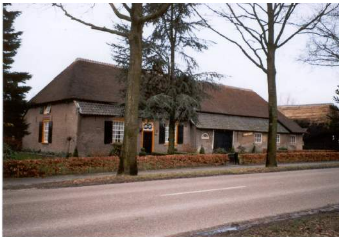
Eén van de oude boerderijen op 't Endeke

Een wat vreemde activiteit voor 't Schoor? Zijdellings verwant met de historie van ons werkgebied, reageerden wij heel positief op een verzoek van de Stichting de Duinboeren, een bijdrage te willen leveren voor een toelichting tijdens een wandeling door o.a. het natuurgebied den Brand. De wandelaars deden namelijk ook de buurtschap 't Endeke aan. 't Schoor was daar ter plaatse om enkele wetenswaardigheden te vertellen over de karakteristieke boerderijen van die buurtschap. Overigens lag het vertrek- en eindpunt voor de deelnemers aan de wandeling bij de Hemelrijkse Hoeve aan de Gommelsestraat.