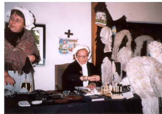
Demonstratie mutsenmaken tijdens de Open Monumentendagen

Op 7 september was ons heemcentrum alsook kasteel de Strijdhoeve in het kader van de landelijke open monumentendag opengesteld. De dag had als motto "koopmansgeest". Speciaal daarvoor waren in de kelder van het kasteel exposities ingericht, die als onderwerp enkele zeer betekenisvolle ambachten uit de Udenhoutse samenleving hadden. Velen kwamen het heemcentrum en het kasteel bezoeken.