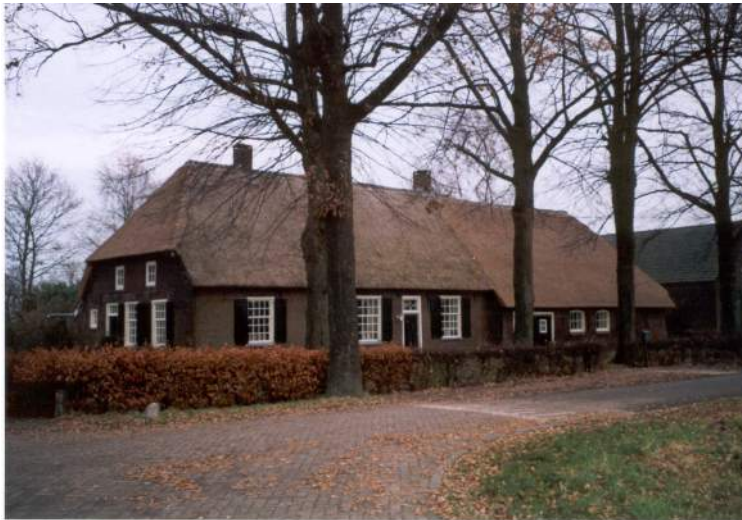
Foto van de boerderij aan de Winkelsestraat in Biezenmortel die gebruikt is voor de intropagina van onze website.

http://home.planet.nl/~schef564/schoor/ .