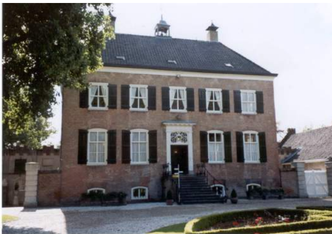
De stutten en steunen kregen dit jaar een rondleiding op de Strijdhoeft

Daarin memoreerde hij o.a. de reden van deze bijeenkomst, bracht dank uit voor de ondersteuning van het werk van het heemcentrum en deed nog eens een beroep op de aanwezigen en ook niet aanwezigen als sympathisant het werk van 't Schoor vooral te blijven steunen.