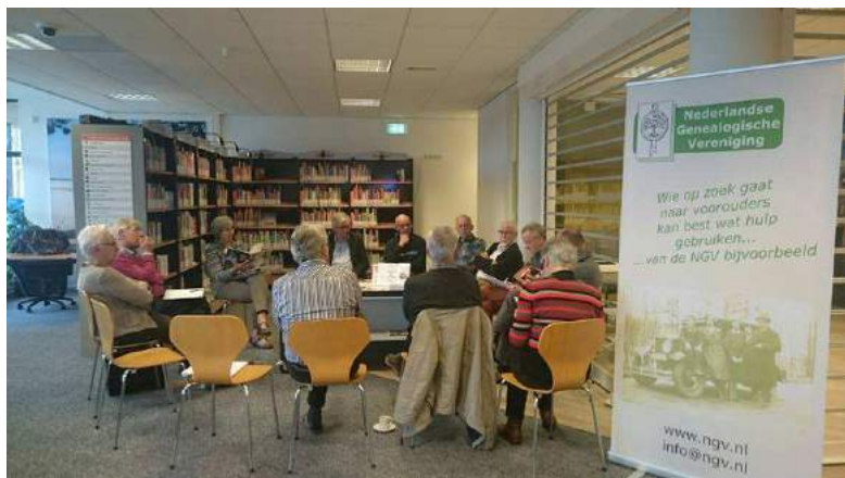
Genealogisch spreekuur in de Udenhoutse bibliotheek

Er werden ook een aantal presentaties gegeven over het zoeken in Aldfaer, het gebruik van de website van het Regionaal Archief Tilburg, een uitleg over het zoeken in Doop,- Trouw en Begraafboeken en een speciale bidprentjesbijeenkomst. Gemiddeld waren er zo'n 15 enthousiaste deelnemers per spreekuur aanwezig. Reden genoeg om ook in 2017 met deze activiteiten door te gaan.