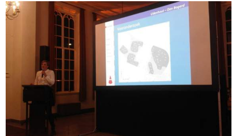
Presentatie van archeologische vondsten in nieuwbouwwijk den Bogerd

Televisie en kranten besteden steeds aandacht aan onze geschiedenis, ook in Udenhout komen steeds meer bezoekers naar onze presentaties en tentoonstellingen. We zijn daar erg blij mee. Onze wekelijkse openstelling op donderdag krijgt langzaam meer bekendheid en dus ook meer bezoekers. Verheugend is ook te melden dat de samenwerking met de Gemeente Tilburg goed is. We zijn in gesprek over een mogelijke uitbreiding van gemeentelijke monumenten en samen met de stadsarcheoloog is een presentatie verzorgd over archeologische vondsten in de nieuwbouwwijk Den Bogerd.